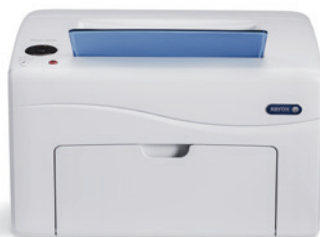
Phaser 6020. Utskrift