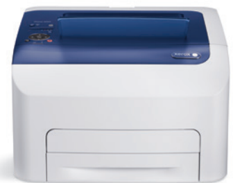
Phaser 6022. Utskrift