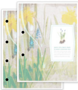
Hulling med 2-4 hull